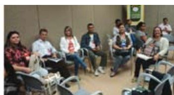
CONSOCIAL - Brasília

- 18 a 20/05/2012 – Participação na CONSOCIAL etapa Nacional, em Brasília