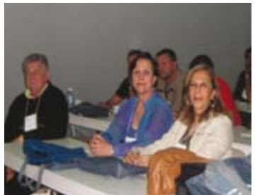
Encontro Nacional de Cidadania e Controle Social na Administração Pública Municipal – AMARRIBO - Ribeirão Bonito – SP - 7 a 9 de setembro de 2006

2. De 25 a 27 de setembro de 2009, a ADAMA esteve presente no 1º Seminário Nacional de Controle Social, em Brasília, onde estavam mais de 500 pessoas, entre cidadãos da sociedade civil, ministros, secretários de Estado e outras autoridades. Ao final do Seminário, através dos integrantes da Rede de Combate à Corrupção, redigiu-se um abaixo assinado, entregue ao ministro Jorge Hage Sobrinho e endereçado ao Presidente da República, solicitando a 1ª Conferência Nacional Sobre Transparência e Controle Social. A proposta foi aprovada pelo então presidente.