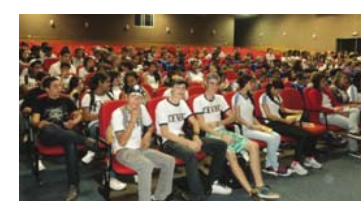
Preparação dos alunos para concurso de redação

m) Visita a empresários em busca de apoio para a realização das ações da ADAMA.