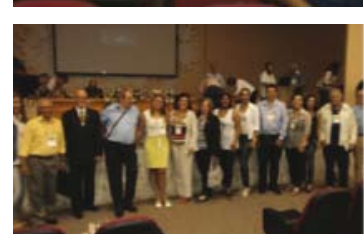
Consocial em Maringá, em 24/11/2011

t) Recebimento pela ADAMA, em novembro de 2011, de produtos doados pela Receita Federal para a