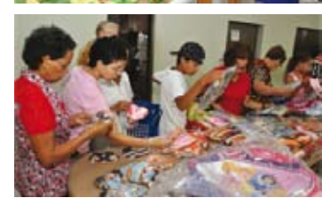
Bazar com produtos doados pela Receita Federal de Maringá