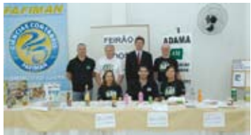
Feirão do Imposto