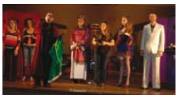
Teatro – Grupo SER/UEM – Seminário: "Semeando a Cidadania Fiscal" - 2011"

o) Realização de palestras; feirão de imposto; apresentação de material audiovisual; concurso de redação; apresentação de teatro, música e poesia. O evento que englobou essas atividades teve como título: "Semeando a Cidadania Fiscal" e foi realizado em parceria com a Faculdade de Filosofia, Ciências e Letras de Mandaguari, Associação Comercial e Empresarial de Mandaguari e Agência da Receita Federal de Jandaia do Sul. Nos quatro dias do evento participaram 2070 pessoas entre estudantes, autoridades e comunidade em geral.