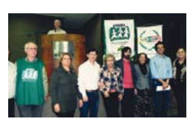
Parceiros e palestrantes do evento "Cidadania se conquista através de conhecimento, liberdade de expressão e ação" – 25 e 26/05/2012