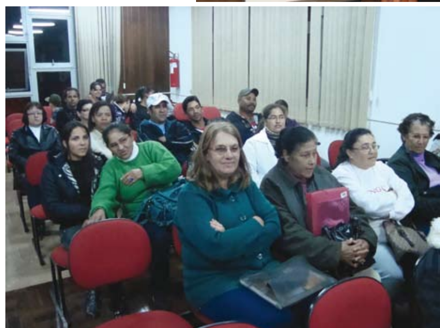
Alunos do CEEBJA Santa Clara acompanhando a sessão da Câmara na qual suas reivindicações foram discutidas e votadas pelos vereadores

se desenvolve o trabalho legislativo, pesquisaram sobre os seus direitos e em breve levarão pessoalmente suas reivindicações aos vereadores. “Nosso objetivo é despertar nesses