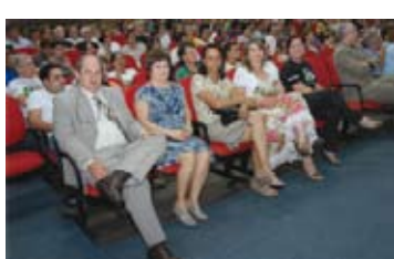
Seminário – Semeando a Cidadania Fiscal 2011

p) Participação em conferência da FACIAP, em Foz do Iguaçu, em novembro de 2011, onde houve palestra sobre "Controle Social via Observatório Social", proferida pelo