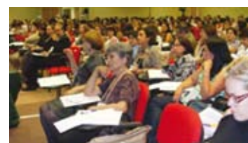
Participação da ADAMA no 1º Seminário Nacional de Controle Social – Brasília 2009

3. Depois de mobilizar cerca de um milhão de pessoas, realizar 302 conferências livres e contar com a participação de 150 mil brasileiros, a 1ª Conferência Nacional Sobre Transparência e Controle Social (CONSOCIAL) chega a etapa final com o objetivo de priorizar 80 propostas das mais de 20,5 mil sugestões para a construção do Plano Nacional Sobre Transparência e Controle Social. Aconteceu em Brasília, de 18 a 20 de maio de 2012.