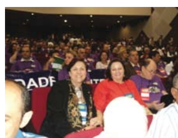
CONSOCIAL – Brasília, 18 a 20 de maio de 2012