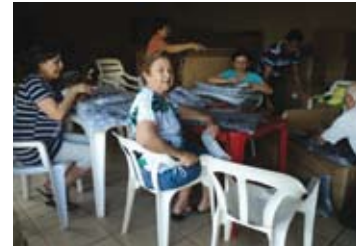
Preparação das mercadorias para o bazar

u) Realização do bazar com os produtos citados, no período de 10 a 15 de fevereiro de 2012. Os recursos obtidos com esse trabalho estão sendo utilizados para aquisição de móveis, equipamentos, contratação de funcionários e para contribuir com a manutenção da ADAMA.