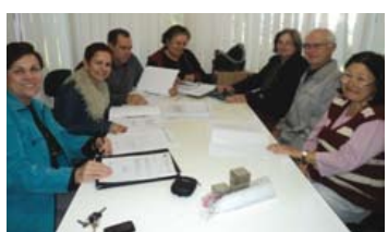
Reunião para análise de documentos Comissão de Finanças e Orçamento, do Conselho Municipal de Saúde

b) Participação, como conselheiros da área não governamental, em conselhos municipais de políticas públicas, inclusive em diferentes comissões do Conselho Municipal de Saúde.