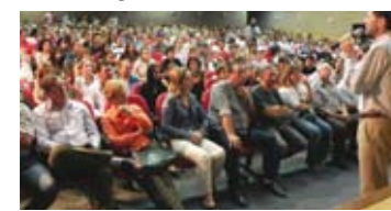
Palestra Show "A Constituição, a Educação e a construção da cidadania"