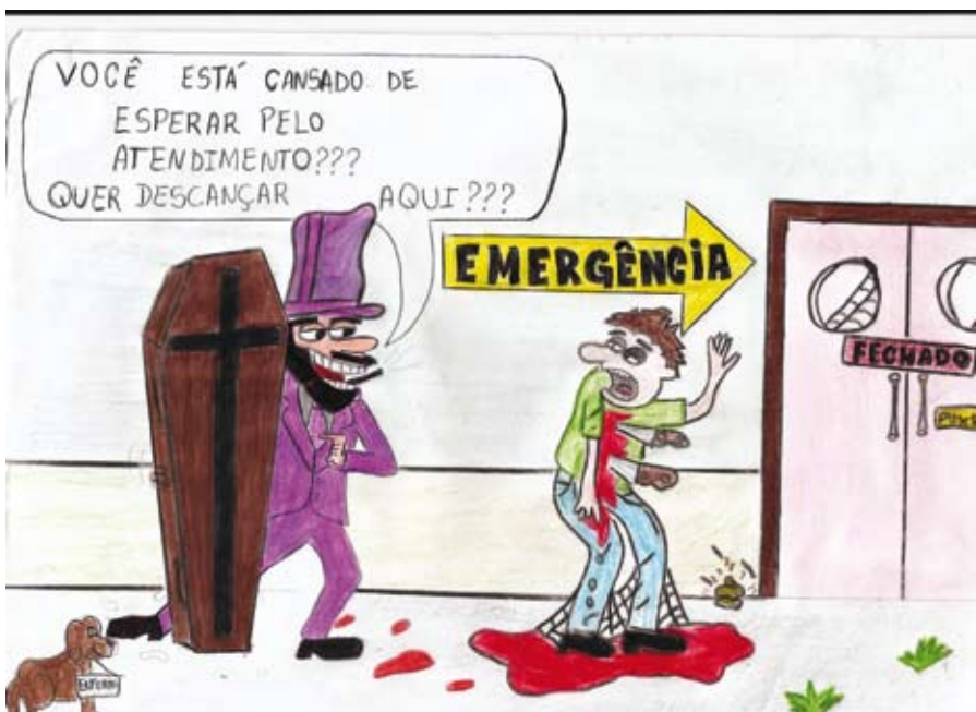
Charge (acima) e redação (ao lado), produzidas pelos estudantes do CEVEC