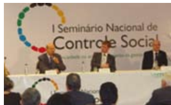
Ministro Jorge Hage Sobrinho no 1º Seminário Nacional de Controle Social – Brasília 2009

foram realizadas as conferências municipais, regionais, estaduais e virtuais nas quais a ADAMA também marcou presença.