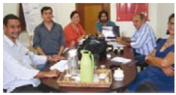
Encontro em São Paulo, com a "Article 19"

-04 a 07/03/2012 – Encontro em São Paulo, com a "Article 19" e AMARRIBO Brasil, para tratar sobre implementação da Lei de Acesso à Informação;