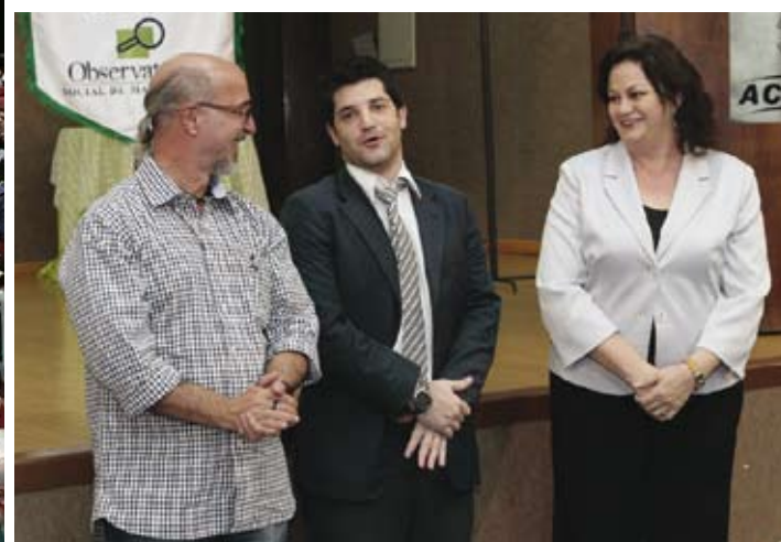
Ao lado imagem do público que lotou o Centro de Convenções para participar do evento e acima os palestrantes que passaram suas mensagens sobre Controle Social, Direito à Informação e transparência no poder público