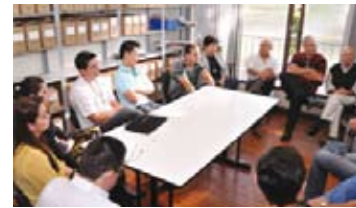
Equipe do Observatório Social de Maringá em visita à Prefeitura Municipal

h) Acompanhamento à visita feita em maio de 2011 pelo Observatório Social de Maringá, por intermédio da ADAMA, para repassar informações obtidas em cursos para o setor de compras e licitações da Prefeitura. Um dos temas foi o Termo de Referência e Projeto Básico – planejamento para as aquisições. Na ocasião estiveram presentes, além da equipe de Maringá, seis membros da ADAMA e servidores da prefeitura que atuam nos setores de licitações, compras e finanças.