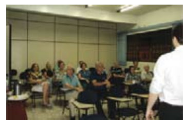
Visita do coordenador do Observatório Social do Brasil

2011 durante visita para orientações, esclarecimentos e apoio ao trabalho da ADAMA.