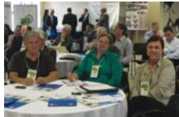
Encontro da Rede OSB de Controle Social – Curitiba – 30 e 31/03/2012

-29, 30 e 31/03/2012 – Participação em Encontro da Rede OSB de Controle Social, em Curitiba, no qual estavam presentes muitas autoridades do cenário estadual e nacional.