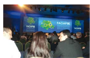
Conferência FOCIAP em Foz do Iguaçu e Assembleia OSB de Controle Social

q) Realização de reuniões, em novembro de 2011, com vários segmentos da sociedade, para explicar sobre a CONSOCIAL – Conferência Nacional de Controle Social e solicitar mobilização a fim de que diferentes segmentos da comunidade participassem dessa iniciativa em Maringá.