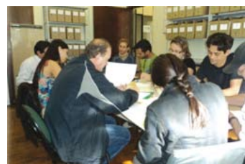
Participação da ADAMA em licitação da Prefeitura Municipal

De acordo com os voluntários da ADAMA, esse acompanhamento permitiria conferir se o que está sendo entregue confere com a nota fiscal, a quantidade e o valor contratado na licitação. Segundo eles, isso já ocorre em outros municípios que tem Observatório Social.