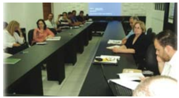
Organização da CONSOCIAL Regional – Maringá

-04 a 07/03/2012 – Encontro em São Paulo, com a "Article 19" e AMARRIBO Brasil, para tratar sobre implementação da Lei de Acesso à Informação;