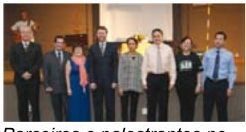
Parceiros e palestrantes no Seminário