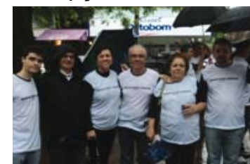
Passeata contra corrupção

x) Participação, à convite de membros da Loja Maçônica, na passeata que aconteceu em abril 2012, em Maringá, com o tema "Sociedade maringaense contra corrupção".