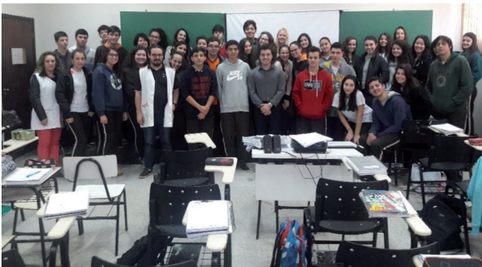
Alunos do Colégio São Francisco de Assis